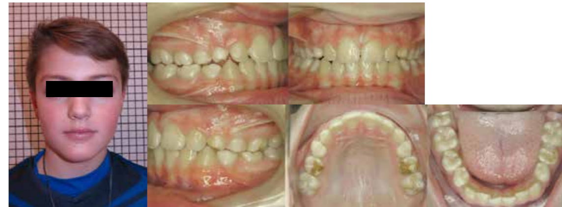
Vorläufiger Abschluss- befund der Früh- behandlung mit 10,4 Jahren