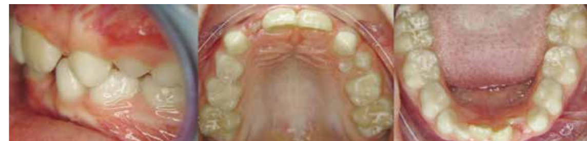
Vorläufiger Abschluss der Frühbehandlung mit 11,2 Jahre: die wahrscheinliche unterminierende Resorption 63 konnte verhindert werden